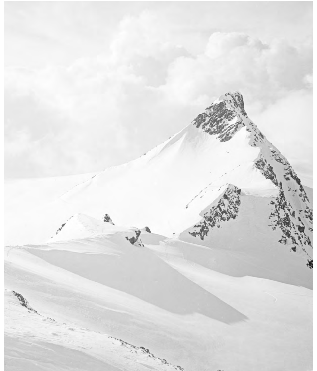
Foto: Vermunt, Fuorcla dal Cunfin, Silvretta/letscherkamm, Signalhorn, Sammlung Risch-Lau, Vorarlberger Landesbibliothek

Die BTV Leasing ist ein Unternehmen mit Geist und Haltung. Geist bedeutet, das Richtige zu erkennen, Haltung bedeutet, das Richtige zu tun. Aus dieser inneren Überzeugung heraus befassen wir uns intensiv mit Zukunftsthemen und entwickeln nachhaltige Lösungen. Für den Weg mit unseren Kund*innen.